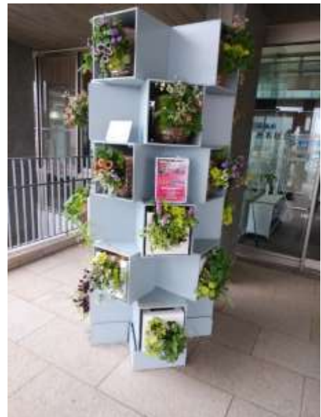
DW ファイバーを使用した SDGs タワー(洲本市)