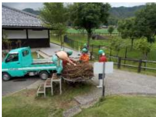
コウノトリの巣作り(豊岡市)

現代の日本には「環境、防災、森林、景観」など、解決できていない様々な課題があります。当社は但馬・丹波・播磨・摂津・淡路の兵庫五国という豊かな環境に恵まれたフィールドを拠点に“みどり”＝自然(地球)を相手に事業を展開し、未来の社会のために課題(困り事)の解決に向けて取り組んでおります。