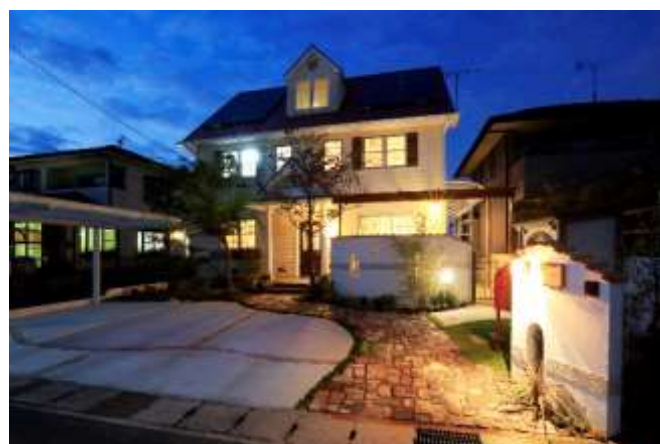
外構・ガーデン工事(姫路市)