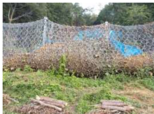
インパクトバリアが土砂を補足(西宮市)