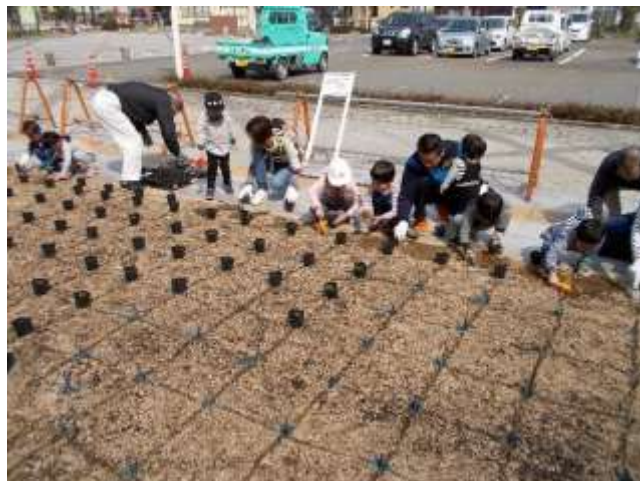
市民と共に緑化(豊岡市)

造園事業では、植樹・植栽や剪定、芝張りなど様々な手法によって庭園・公園や道路・建築物などを緑化し、景観を向上させたり緑を復活させたりしています。この事業は都市部における緑化の推進や農村インフラの維持・保全などにもつながります。