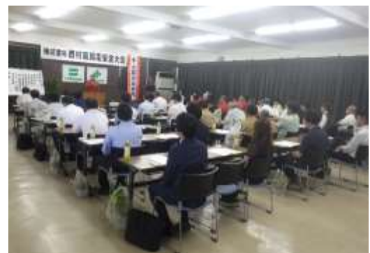
安全大会にて協力会社とゼロ災害