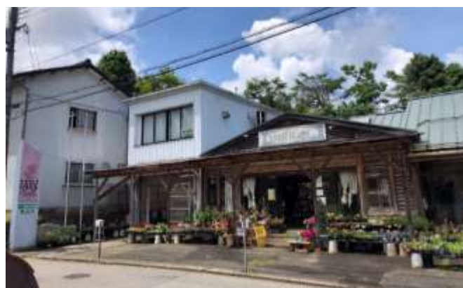
ANNEX はなかんざし(豊岡市)

主に多種多様な植物やガーデニング用品などを販売している「ANNEX はなかんざし」や、個人のお庭向けの外構・ガーデン工事を取り扱っています。植物は、私たちに精神的な安らぎを与えてくれます。また、現在DWファイバーと呼ばれる土壌改良材に関する取り組みも進めており、新たな事業に積極的に携わっています。