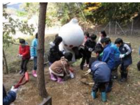
コウちゃんと植樹(豊岡市)