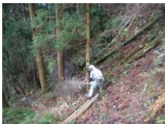
森林整備・伐採作業の様子(灘区)

森林整備事業は2008年から始めた比較的新しい取り組みです。樹木の伐採や治療、森林調査、里山の修景などによって豊かな自然を守る事業に取り組んでいます。自然を守ることは生産資源の増加を促進させたり、森林(山)を守る(再生させる)ことによって水を守ることにつなげたり*することができます。*森は海の恋人