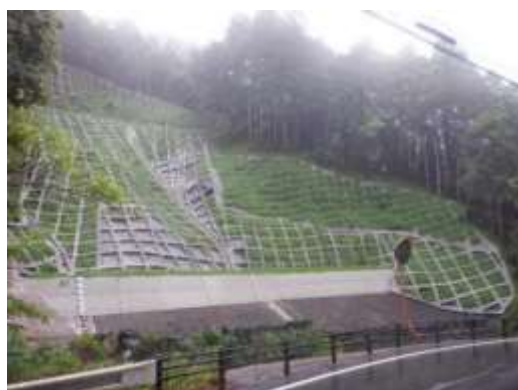
山腹崩壊を防ぐ法面工事(宝塚市)

近年、自然災害による被害が年々増加しています。防災事業では、地震や洪水、土砂崩れの発生などによって地滑りを起こしたり、崩壊・落石の危険性があつたりする山の斜面などに対して、被害を防ぐための工事を行っています。この事業の推進によって、安心できる生活環境の維持や、インフラ整備・防災産業の普及に努めています。