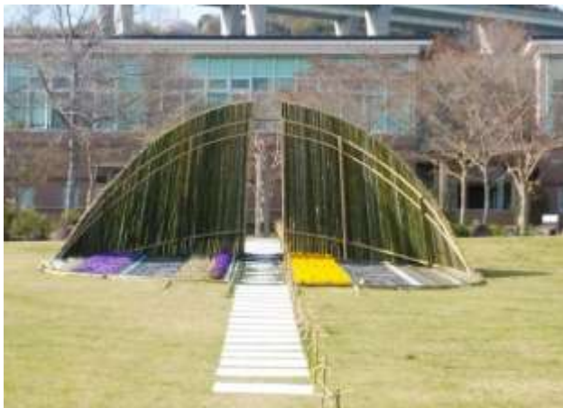
DW ファイバーを使用した SDGs ガーデン(淡路市)