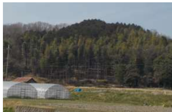
野生動物共生林整備(西区)