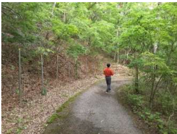
たじま高原植物園での検討業務(香美町)