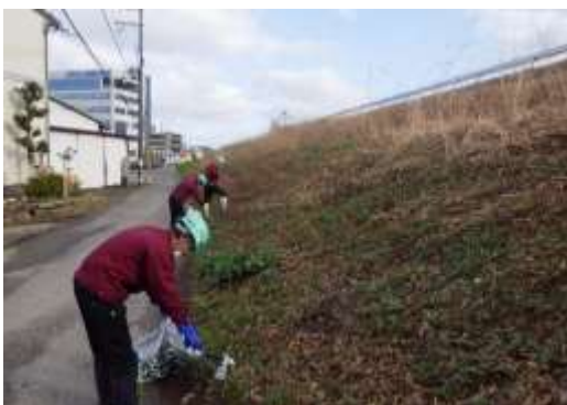
ボランティア清掃

当社は「共存共栄 ※ 」を重んじ、「全てに感謝し世のため人のために働いて生きていく」ことを大黒柱(企業理念)としています。“みどり”を軸とした事業に取り組むことで、社会に貢献しております。※共存共栄：「2つ以上のものがお互いに助け合い生存し、共に栄えること